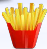
Frites met mayo